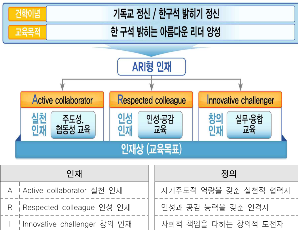
[그림 II-1] 건학이념, 교육목적 및 인재상