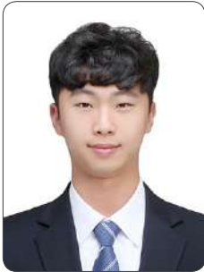
방 O 훈