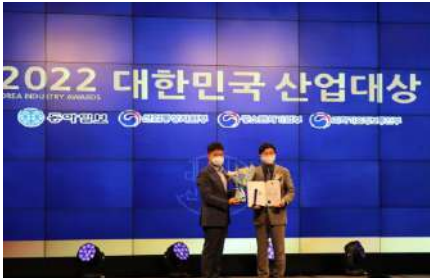
2022 대한민국 산업대상 (기술혁신 부문, 중소벤처기업부 장관상)