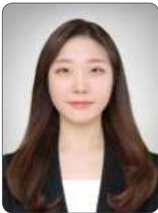
서 O 진

취업 준비중이신 분들, IT쪽 이직을 생각하시는 분들께 한국 소프트웨어 산업협회 채용확정형 교육을 꼭 받아보시길 추천드립니다!