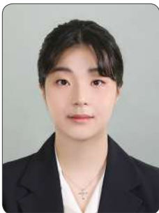
공 O 재

개발자가 되고 싶은 열정은 있지만 어떻게 준비해야 하는지 방향을 잡지 못하셨다면 KOSA의 교육을 수료하는 것을 강하게 추천합니다!