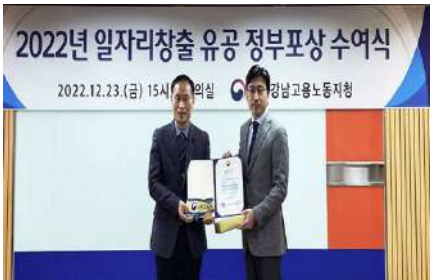
2022 대한민국 일자리 으뜸기업 선정 (2021년, 2022년 2년 연속 선정)