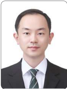
오 O 세

안녕하세요! 2022년 상반기 웹 서비스 개발자 과정 수료생입니다. IT 관련 학과를 다녔지만 4학년 때 취업을 어떻게 준비해야 하는지 방향하며 졸업을 앞두던 즈음, KOSA의 채용확정형 교육을 발견하였습니다. 이러한 교육은 다양한 기관에서 진행하고 있지만, KOSA는 그 중에서 SW와 관련해서는 가장 신뢰성 있는 기관이라고 판단하였습니다. 또한 커리큘럼 또한 체계적으로 구성되어 있어 취업을 준비하는 저로써는 정말 적합한 교육과정이라고 생각하여 지원했습니다.