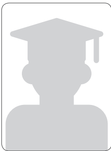
이 O 석

특히 동기들과 함께 교육 과정을 겪으면서 많은 추억도 쌓을 수 있었고, 각자 부족한 부분들을 서로 서로 채워가면서 과정을 밟아가다 보니 훨씬 더 좋은 시너지를 낼 수 있었던 것 같습니다. 현재 본인이 개발자로서의 취업 과정에 확신이 없거나 혼자서 취업 준비하는 것에 부담이 있으신 분들에게는 이 채용확정형 교육 과정을 적극 추천드립니다!