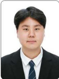
변 O 혁

안녕하세요. 2022년 현대IT&E 채용확정형 SW 개발자 양성과정 4기 수료생입니다.