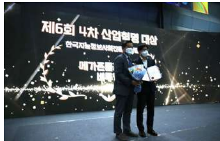
제6회 4차산업혁명 대상 (과학기술방송통신위원회 위원장상)