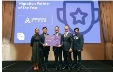
AWS 올해의 컨설팅 파트너상 (마이그레이션 부문)