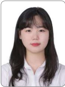
권 O 아