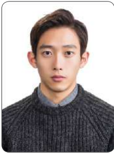
오 오 성