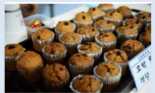
④ 천연재료를 이용한 웨빙머핀 (강릉원주대)