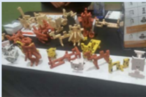
③ 교구용 한글블록 (2015 산학협력 EXPO)