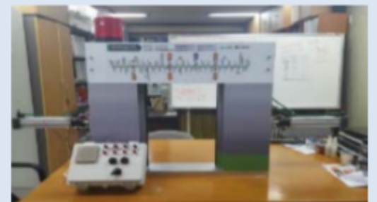
② 안전시스템문 (인천대)(2016 산업통상자원부 장관상)